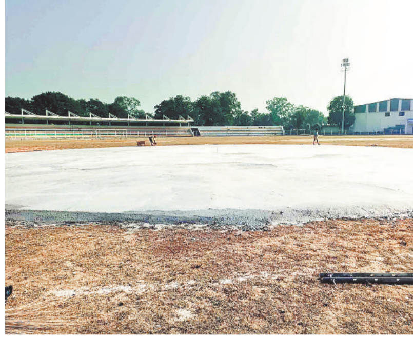
गांधी स्टेडियम में तैयार हेलीपैड।