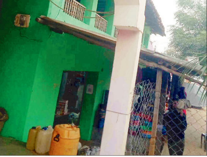
घर में लगा विद्युत मीटर।

दूरस्थ चांदनी-बिहारपुर क्षेत्र की प्राकृतिक समृद्धि ग्रामीणों के विकास में बड़ी बाधा साबित हो रही है। वन बाधा होने के कारण न तो गांवों तक सड़के बन पा रहे हैं न ही विद्युत सुविधाओं का विस्तार हो रहा है। आजादी के 78 साल गुजरने के बाद भी ग्रामीण ढीबरी के भरोसे जीवन यापन करने मजबूर हैं। विद्युत सुविधा उपलब्ध नहीं होने पर शासन द्वारा इन गांवों को सीर ऊर्जा से रोशन करने का निर्णय लिया गया था। क्रेडा द्वारा इन ग्रामों में वर्ष 2012-13 में सोलर पावर प्लांट स्थापित करने के साथ ही ग्रामीणों को अपने घरों को रोशन करने सोलर होम लाइट उपलब्ध कराया गया था। सोलर लाइट लगने से ग्रामीणों को बड़ी सुविधा मिली साथ ही उनके जीवन में सुधार आया। पांच साल का समय गुजरने के बाद सोलर पावर प्लांट एवं होम लाइट में खराबी आने लगी। लगातार शिकायतें मिलने के बाद विभाग ने कुछ स्थानों पर